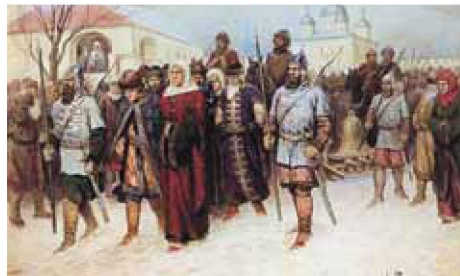
А. Кившенко. Присоединение Великого Новгорода. Высылка в Москву знатных и именитых новгородцев

Полтора столетия росла вражда между быв-