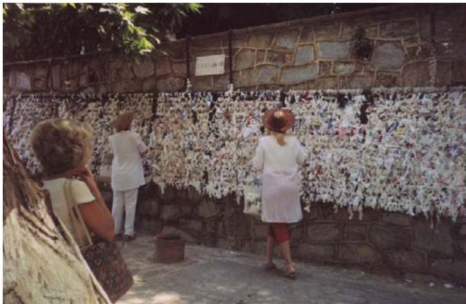
Илл. 5 – Дом Успения Пресвятой Богородицы г. Эфес, Турция. 2003 г.