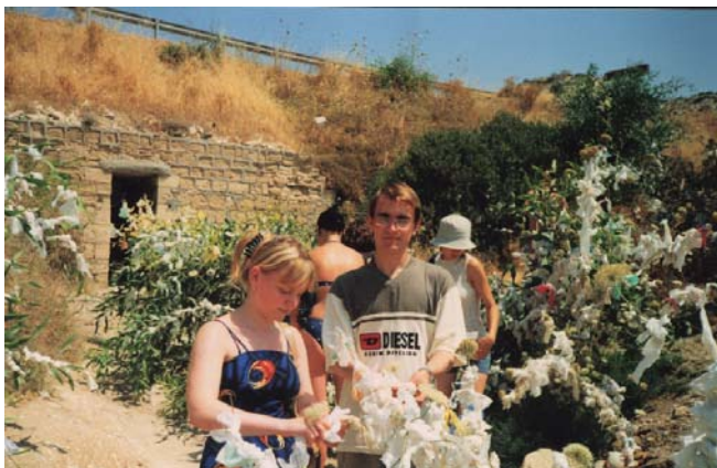
Илл. 6 – Место рождения Афродиты, Кипр.