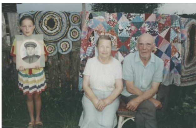
Илл. 9. Жители д. Чертеж Пиксимовского с/с Вашкинского р-на Вологодской обл. 2001 г.