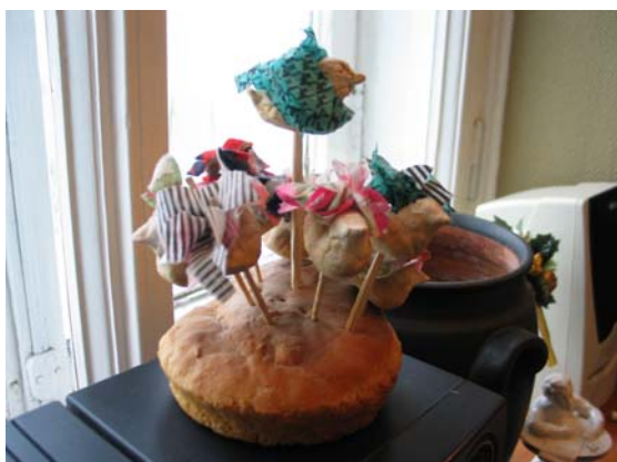
Илл. 2 – Свадебный пирог с уточками. Д. Глушково Глушковского с/с Белозерского р-на Вологодской обл. 2003 г.