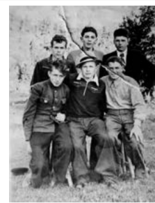
ПАРНИ. 50-Е ГОДЫ. МЕНЬ. ФОТОАРХИВ ПРОПОВСКОГО ЦЕНТРА

которая дает человеку чувствовать себя частью чего-то целого, большего, чем он сам. Интересно, например, что если брать опять-таки нашу отечественную культуру, то, например, мужские отношения оказываются более теплыми и близкими, чем женские. Тактильные отношения меду мужчинами чаще возможны... Моя коллега занималась анализом деревенских фотографий, она рассматривала жесты: кто как кого держит, кто как стоит и прочее. Телесный контакт связан с поддержкой и принятием в сообществе. Далее — уважение и самоуважение. По Маслоу, это такая сложная двусторонняя вещь, потому что, с одной стороны, она предполагает компетентность — то есть, я сам себя должен за что-то уважать, например, за то, что я профессионал. Но она же предполагает и внешнее признание. Ну, например, мне было долгое время трудно с самой собой договориться, где я сама себя признаю, как профессионала, а где я желаю, чтобы меня оценили. Рассортировать внутри себя это очень трудно. Потому что, с одной стороны, если ты реализуешься в какой-то профессии, тебе нужно, чтобы профессионалы тебя признали, и ты