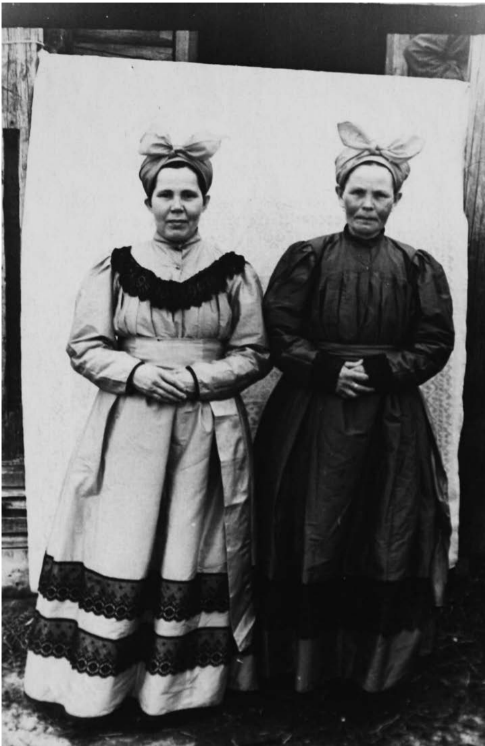
ЗАМУЖНИЕ ЖЕНЩИНЫ, ФОТО 20-Х ГГ. МЕЗЕНЬ.