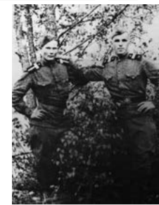
АРМЕЙСКАЯ ФОТОГРАФИЯ. 60-Е ГОДЫ.

нуждаешься в этой оценке и страдаешь, если не оценивают. С другой стороны, в какой-то момент твоя компетенция становится какой-то такой, когда тебе нужно признать ее самому, а это оказывается в нашей культуре очень трудно. Потому что обычно мы ведем себя так: «Какая у тебя красивая кофточка!» — «Да, я тут на помойке ее купила!» Или: «Как ты прекрасно выглядишь!» — «Да нет, что ты...» То есть мы всегда играем на понижение. Эта наша культурная норма: хвалиться и хвастаться нехорошо. Мы знаем это твердо. Хотя во всех указаниях по набору персонала сказано, что нужно аккуратно выставить все свои достоинства... Но мы-то знаем, что это