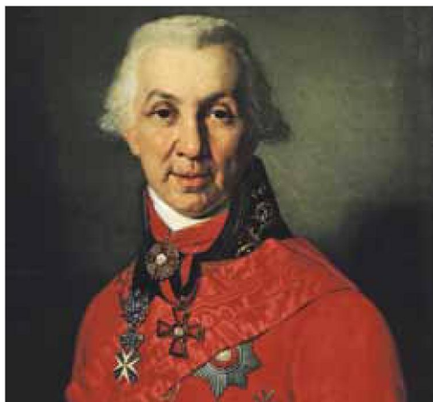
В. Л. Боровиковский. Портрет Г. Р. Державина. 1811 г.